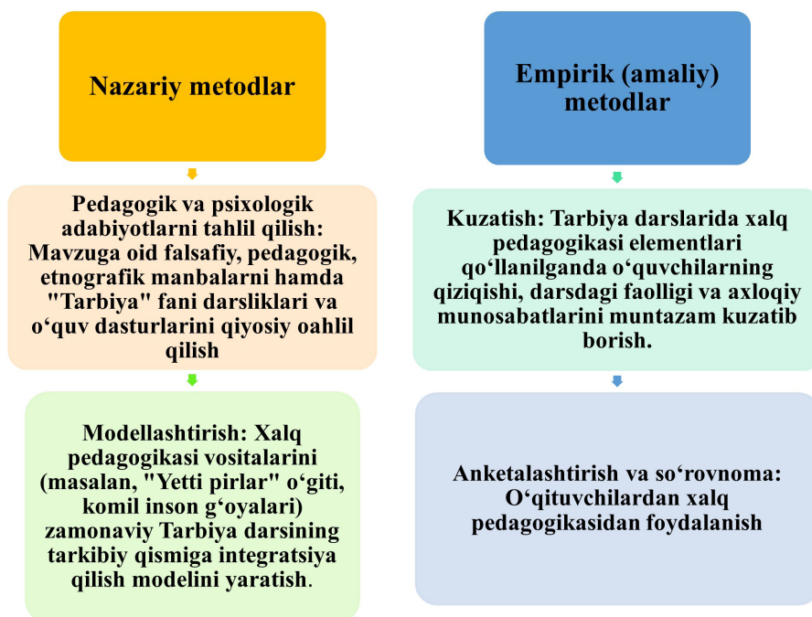
2-rasm: Pedagogik imkoniyatlarni ochib beruvchi metodlar

Mazkur tadqiqotning metodologik asosi shaxsni har tomonlama rivojlantirish, uning ma'naviy-axloqiy qiyo-fasini shakllantirishda milliy va umuminsoniy qadriyatlar uyg'unligi tamoyillariga tayanadi. Mavzuni yoritish, uning pedagogik imkoniyatlarini ochib berish va amaliyotda tekshirib ko'rish uchun quyidagi metodlar majmua-sidan foydalaniladi: