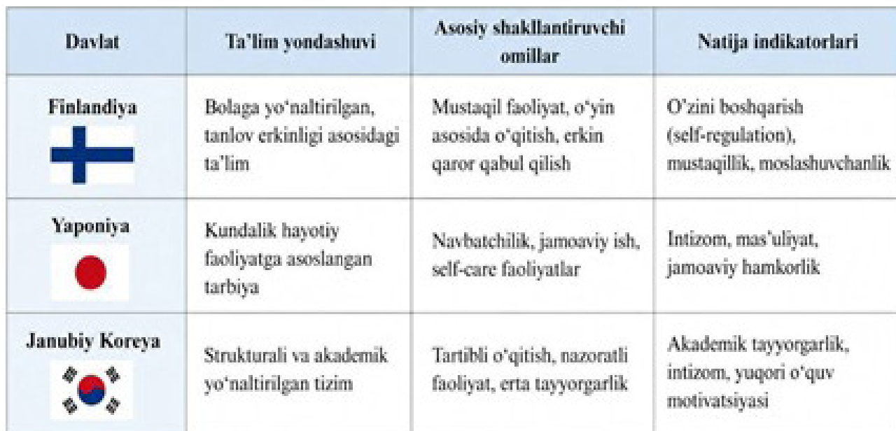
2-jadval: Finlyandiya, Yaponiya va Janubiy Koreya maktabgacha ta'lim tizimlarida mehnatsevarlik va tejamkorlikni shakllantirish yondashuvlari

Izoh. Jadvaldan ko'rinadiki, Finlandiya ta'lim tizimida bolalarning mustaqil faoliyatga yo'naltirilishi ularning o'zini boshqarish va mustaqil qaror qabul qilish ko'nikmalarini rivojlantiradi. Yaponiya tajribasida esa kundalik hayotiy vazifalarni mustaqil bajarish va jamoaviy faoliyatlar orqali mehnatsevarlik hamda mas'uliyat hissi shakllantiriladi. Janubiy Koreya ta'lim tizimi esa strukturali yondashuv asosida bolalarning akademik tayyorgarligi va intizomini kuchaytirishga qaratilganligi bilan ajralib turadi. Umuman olganda, ushbu yondashuvlarning barchasi bolalarda mehnatsevarlik va ijtimoiy mas'uliyatni shakllantirishga xizmat qiladi, biroq ularning metodlari va ustuvor yo'nalishlari turlicha hisoblanadi.