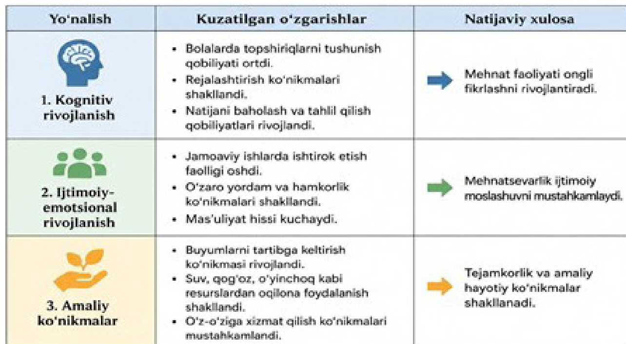
2-jadval: Tadqiqot natijalarining asosiy yo'nalishlari

Tadqiqot davomida maktabgacha yoshdagi bolalarda mehnatsevarlik va tejamkorlik fazilatlarini shakllantirishga ta'sir etuvchi pedagogik omillar tahlil qilindi. O'rganilgan ilmiy manbalar va xalqaro tajribalar natijasida ushbu fazilatlarining rivojlanishi bevosita bolaning kundalik faoliyati mazmuni bilan bog'liqligi aniqlandi. Ya'ni, bolaga tayyor bilim berish emas, balki uni amaliy faoliyat jarayoniga jalb etish mehnatga nisbatan ijobiy munosabat shakllanishining asosiy omili hisoblanadi.