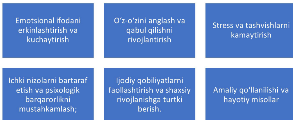
1-rasm: Art-terapiyaning talaba shaxsiga pedagogik va psixologik ta'siri

Art-terapiyaning asosiy vazifalari quyidagilardan iborat: