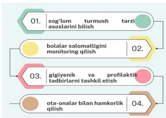
1-rasm: Valeologik tarbiya asosidagi kompetentlik

Valeologiya inson salomatligini saqlash va mustahkamlashga qaratilgan fan sifatida pedagogika bilan uzviy bog'liqdir. Maktabgacha ta'lim tizimida valeologik tarbiya bolalarga sog'lom turmush tarzini o'rgatish, gigiyenik ko'nikmalarni shakllantirish va jismoniy faollikni rivojlantirishni nazarda tutadi. Tarbiyachilar esa ushbu jarayonni tashkil etuvchi asosiy subyekt bo'lib, ular quyidagi kompetensiyalarga ega bo'lishi lozim [3]: