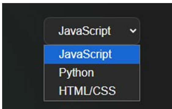
2-rasm: Interaktiv o‘yinda dasturlash tilini tanlash oynasi

Bundan tashqari, platformada foydalanuvchilarga turli dasturlash tillarida ishlash imkoniyati ham yaratilgan. Bu esa o‘quvchilarning turli dasturlash muhitlari bilan tanishishiga hamda ularning kasbiy ko‘nikmalarini kengaytirishga yordam beradi.