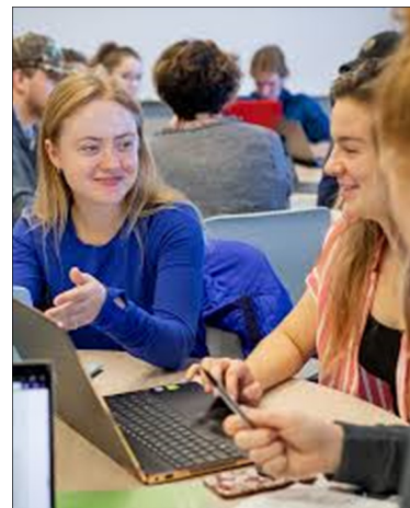
2-rasm: AQSh Liberal arts kollejlari ijodiy topshirlar ustida ishlash jarayoni

Bugungi kundagi AQSh ta'lim tizimining rivojlanish yo'nalishlari raqamli va masofaviy ta'lim, STEM va STEAM ta'limining ustuvorligi, inklyuziv va teng imkoniyatli ta'lim kabi tamoyillarga tayangan. Misol uchun raqamli va masofaviy ta'lim yo'nalishida so'nggi yillarda AQShda Coursera, edX kabi onlayn kurslar, gibrid ta'lim, sun'iy intellekt asosidagi baholash tizimlari keng joriy etilmoqda.