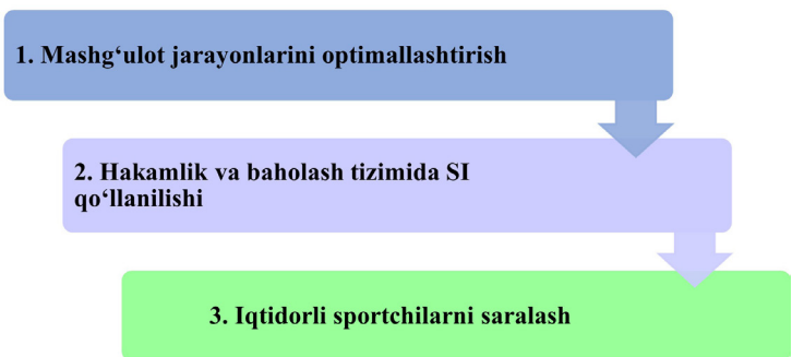
1-rasm: Innovatsion texnologiyalar asosida mashg'ulot jarayonini boshqarish modellari

Mashg'ulot jarayonlarini optimallashtirish: sun'iy intellekt sportchilarning mashg'ulotlarini tahlil qilish va shaxsiylashtirilgan dasturlar ishlab chiqishda yordam beradi. Sun'iy intellekt video tahlil orqali gimnastning harakatlarini real vaqtda tahlil qilib, texnik xatolarini aniqlaydi va murabbiylarga ularni tuzatish bo'yicha tavsiyalar beradi. Bu jarayonda harakatlarni aniqlash algoritmlari va tizimli texnologiyalardan foydalaniladi. Masalan, SI gimnastning sakrash yoki burilishdagi burchaklarini o'lchab, optimal texnikani taklif qilishi mumkin (2-rasm).