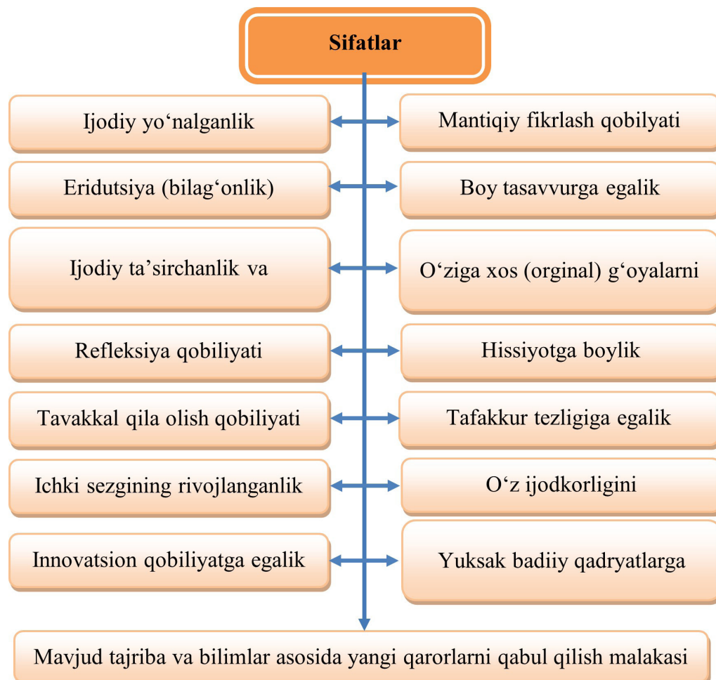
2-rasm: Shaxsga xos innovatsionlik sifatlarining turlari

fantaziya, tadqiqotchilik va refleksiyaning qamrab oladi. Qo'yilgan vazifaga faqatgina innovatsion ta'lim metodikasini maqsadli holda olib borish bilan erishish mumkin, bunda pedagogik jarayonning har bir ishtirokchisiga yangi bilimlarni tushuntirish, yaratish va undan samarali foydalanish uchun sharoit yaratishga imkon beradi. "Bugungi kunda innovatsion mutaxassislarni shakllantirish zamonaviy jamiyat ta'lim tizimining asosiy vazifalaridan biridir. Aynan shuning uchun ham so'nggi yillarda innovatsion ta'limni innovatsion rivojlanish shakli tadqiqotchi-pedagoglar tomonidan faol o'rganilib kelinmoqda" [2, 5].