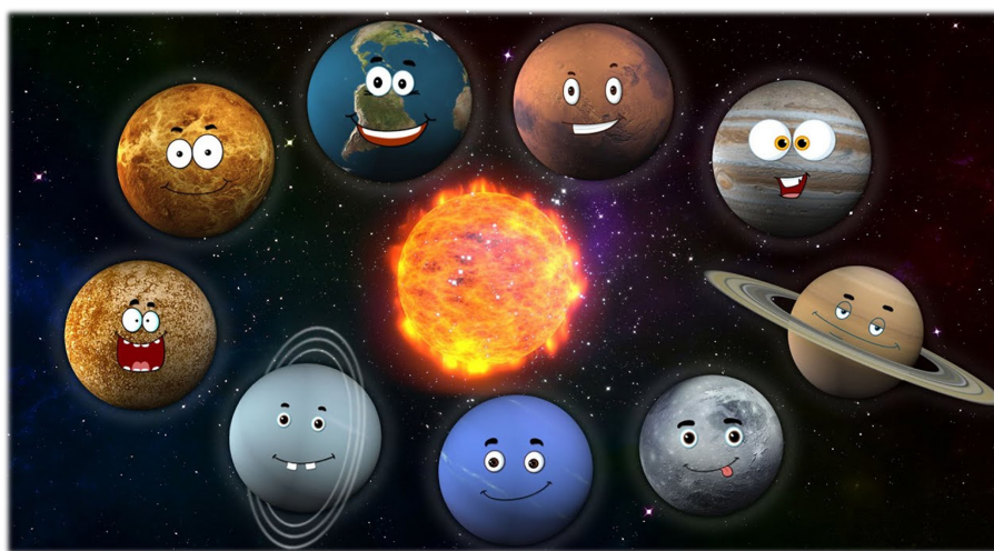
2-rasm: Quyosh tizimi sayyoralarining bolalar uchun interfaol tasviri

“Sayyora va uning sun'iy yo'ldoshlari” shaklida . Markazda – kalit so'z (mavzu) rasm shaklida ifodalana-nadi. Bunda sayyora rasmi chiziladi. Atrofida – birlamchi rasmlar, ya'ni “sun'iy yo'ldoshlar” joylashtiriladi. Ularning atrofida ular bilan bog'liq kichikroq tushunchalar (“sun'iy yo'ldoshlarning yo'ldoshlari”) aks etadi (2-rasm).