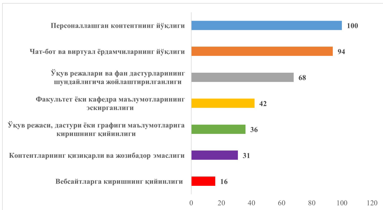
1-rasm: Neft va gaz sohasi mutaxassislarini tayyorlaydigan oliy ta'lim muassasalari rasmiy veb-saytlarining sifati darajasi, foizda 2

Umuman olganda, bu kabi holatlar neft va gaz sohasi mutaxassislarini tayyorlaydigan ko'plab oliy ta'lim muassasalarining rasmiy veb-saytlari raqamli va sun'iy intellekt texnologiyalari nuqtai nazaridan qaralganda, xalqaro ta'lim xizmatlari bozori talablariga yetarli darajada javob bermasligini ko'rsatadi.